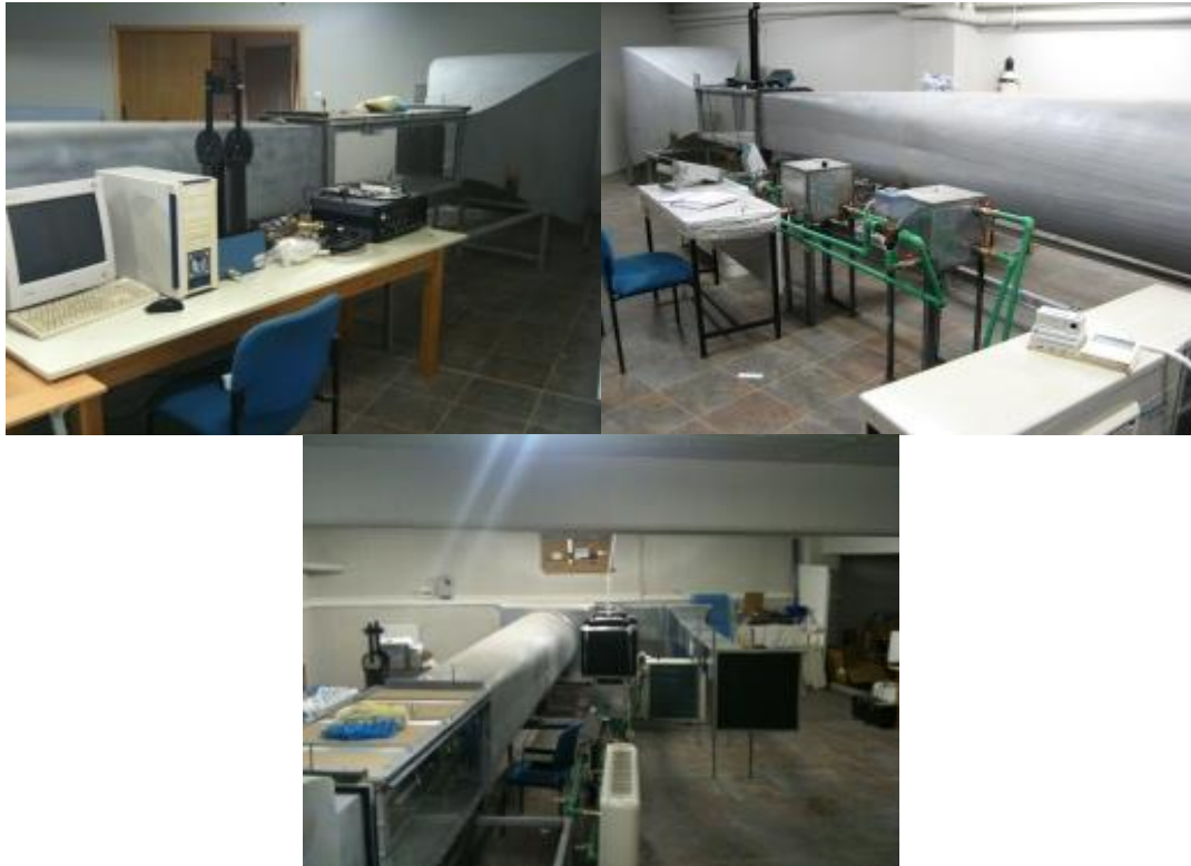
Αεροσήραγγα διατομής 0.50 X 0.50 m2 με διάταξη μελέτης εναλλακτών θερμότητας