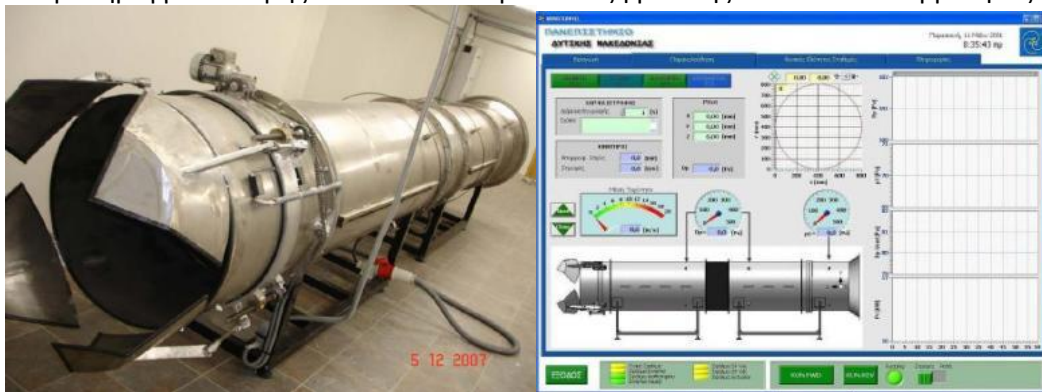
Μεγάλο δοκιμαστήριο ανεμιστήρων