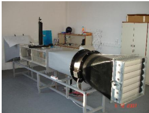
Αεροσήραγγα διατομής 0.35 X 0.35 m 2 .

Ενδεικτικές φωτογραφίες του υπάρχοντος εξοπλισμού παρατίθενται ακολούθως.