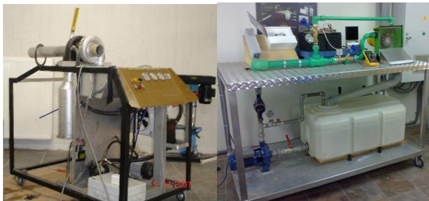
Πειραματική διάταξη αεροστροβίλου και διάταξη υδροστροβίλου Pelton

Πρόσκληση για κατάθεση οικονομικής προσφοράς για: την αποσυναρμολόγηση και την επανατοποθέτηση τριών εργαστηρίων Μηχανικής Ρευστών και Στροβιλομηχανών του Τμήματος Μηχανολόγων Μηχανικών στις νέες εγκαταστάσεις στη ΖΕΠ