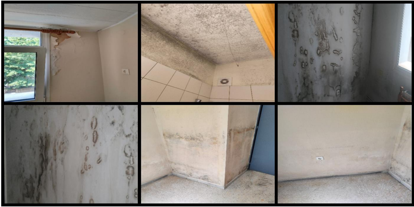
Ενδεικτικές φωτογραφίες κατάστασης δωματίων