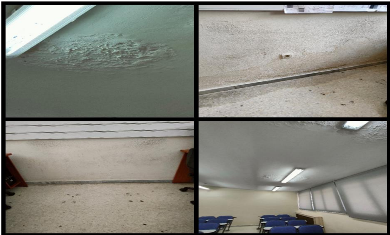
Ενδεικτικές φωτογραφίες κατάστασης αιθουσών