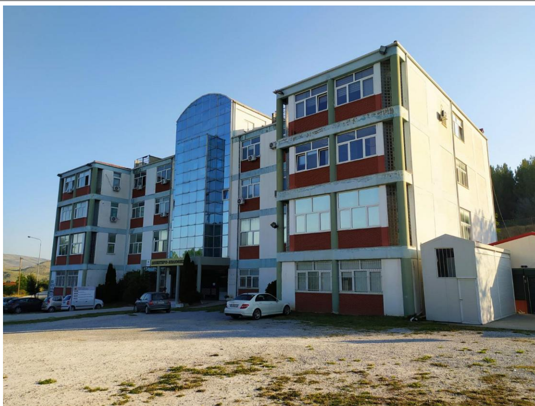
Το Νέο Διοικητήριο του ΠΔΜ, στα Κοίλα Κοζάνης

Η παρούσα τεχνική έκθεση αφορά στη διαμόρφωση του εξωτερικού χώρου, στο Νέο Διοικητήριο του ΠΔΜ, στα Κοίλα Κοζάνης. Μετά στη συγχώνευση του ΤΕΙ με το ΠΔΜ, στο κτίριο αυτό μεταφέρθηκαν όλες σχεδόν οι διοικητικές υπηρεσίες του ιδρύματος, το γραφείο του Πρύτανη και των αντιπρυτάνεων, ενώ στο ίδιο κτίριο φιλοξενείται και η κεντρική βιβλιοθήκη. Το εν λόγω κτίριο δέχεται αρκετό κόσμο, διοικητικό προσωπικό, φοιτητές και επισκέπτες, σε καθημερινή βάση, γι' αυτό ο περιβάλλον χώρος θα πρέπει να διαμορφωθεί για αισθητικούς και λειτουργικούς λόγους.