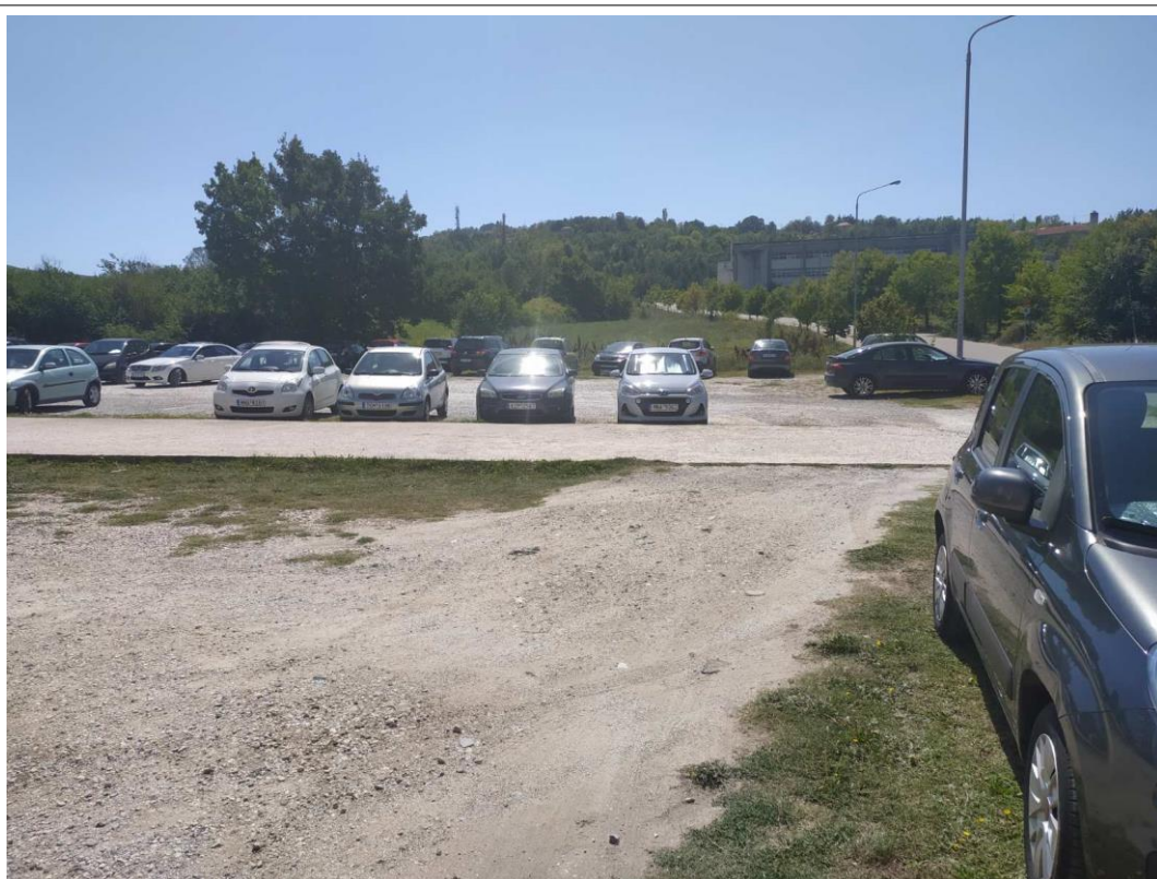
Η υφιστάμενη κατάσταση του ακάλυπτου χώρου στο Νέο Διοικητήριο του ΠΔΜ, στα Κοίλα Κοζάνης

τεχνικό, θα απομακρύνονται με πλαστική σωλήνα Φ500, εγκιβωτισμένη σε σκυρόδεμα, που θα τοποθετηθεί κάτω από τον υφιστάμενο δρόμο, σε άλλο χώρο, με άγρια βλάστηση, εντός της ιδιοκτησίας του ΠΔΜ. Κατάλληλη μέριμνα για τα όμβρια ύδατα με διαμόρφωση κατάλληλων κλίσεων στο έδαφος, θα δοθεί και στον πλακοστρωμένο χώρο πίσω από το Νέο Διοικητήριο, όπου συσσωρεύονται όμβρια ύδατα από τα κάθετα λούκια απορροής των στεγών, τα οποία δεν αποστραγγίζονται και καταλήγουν στο εσωτερικό του κτιρίου, μπροστά από το κεντρικό κλιμακοστάσιο και τον ανελκυστήρα.