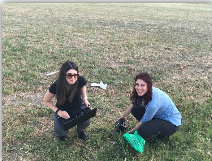
Παραμετροποίηση αισθητήρων εδάφους

Επιπλέον πραγματοποιήθηκε με επιτυχία η δειγματοληψία περιβαλλοντικών μετρήσεων από τα αντίστοιχα χωράφια με τη χρήση ειδικών αισθητήρων εδάφους. Πιο συγκεκριμένα, μελετήθηκαν χαρακτηριστικά του εδάφους σχετικά με την υγρασία, τη θερμοκρασία, αλλά και την υγρασία φυλλώματος.